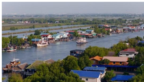
蓝伙行动支持的项目地

3月，“蓝色伙伴关系行动”第三期招募正式截止。本期招募通过联合 IOC-WESTPAC（联合国教科文组织政府间海洋学委员会西太分委）及在 LinkedIn、Instagram 等平台推广，共收到超过 160 个项目申请，目前已启动背调等工作，后续将组织专家评审并正式公布第三期入围项目。