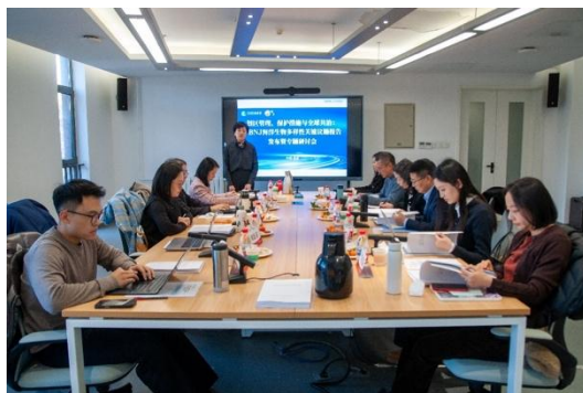
海洋生物多样性关键议题报告会议

1月11日，《划区管理、保护措施与全球共治：BBNJ 海洋生物多样性关键议题报告》发布暨专题研讨会在北京举行。来自自然资源部、中国社会科学院、西南政法大学、北京外国语大学、中国政法大学等高校与科研机构的多位专家学者参与研讨，围绕 BBNJ 协定生效背景下的制度设计、实施路径与中国参与全球海洋治理的关键议题展开交流。