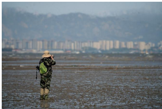
候鸟民间保护网络执行情况

1-3月，25家候鸟民间保护网络伙伴持续开展27个重要鸟类栖息地的守护工作，共开展威胁巡护记录总时长1200个小时，累计鸟类调查天数356天；巡护里程超9100公里；提交鸟类调查记录超过11000条，记录到鸟种数293种，其中国家一级保护动物19种，国家二级保护动物41种。累计调查鸟类数量超222万只；提交偷猎盗猎、污染和开发建设等记录119条；开展科普宣传和自然教育活动19次，超过80个小时，参与人数超过550人。