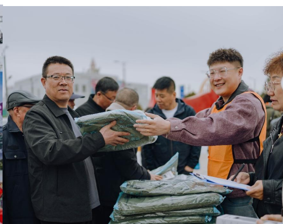
发放护水员巡护物资