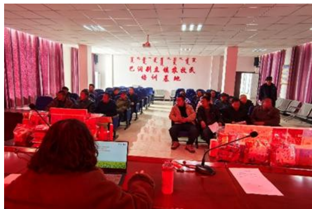
节水小米种植推广会

部分种植地冬季管护情况，种植地基本都拉设了网围栏，未在种植地内直接发现牲畜活动，整体管护情况较好。