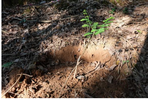
适应力很强的滇橄榄