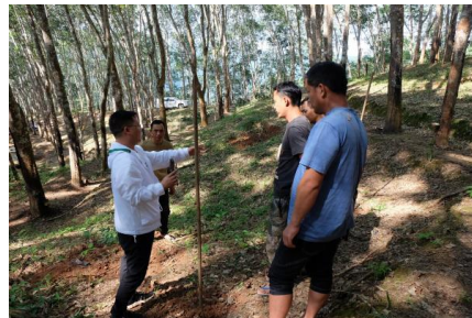
种植方在向村民讲解如何管护树苗