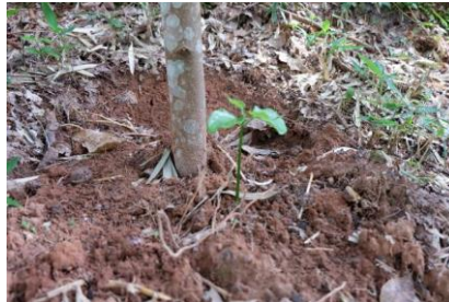
已长出小苗的美藤果