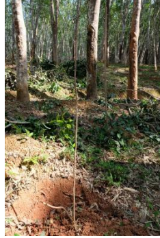
冬季铁刀木已落叶