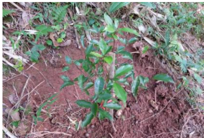
部分牛樟已发出新芽