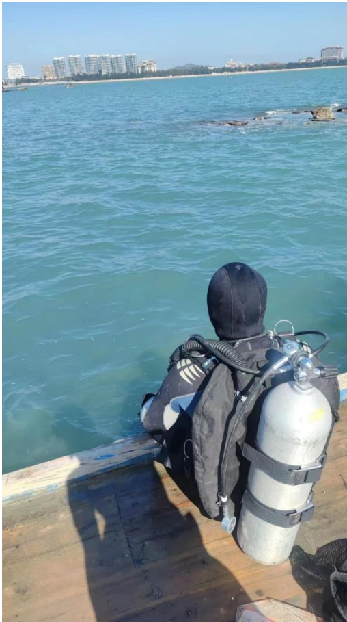
图为项目组人员下水检查监测系统

2024年1月18日，我们再次下水，检查了布设的海底珊瑚在线监测系统的运作情况和数据传送基站。