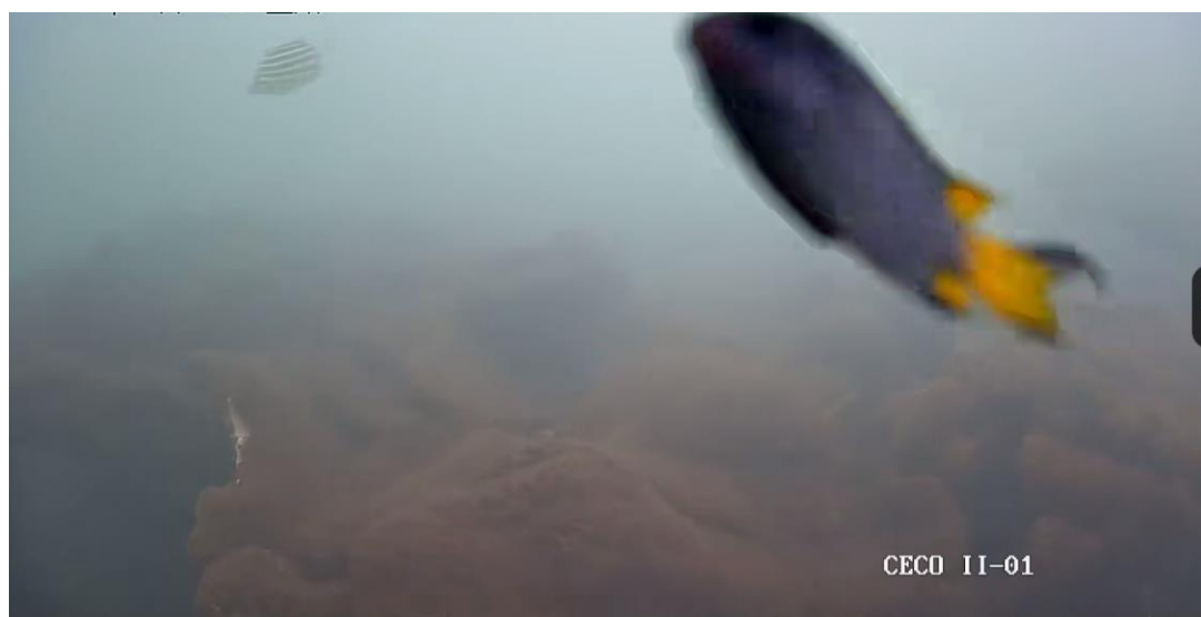
图为海底珊瑚在线监测系统视频记录的鱼类

的鱼类多样性，鱼类是海洋生态系统中一个重要的组成部分。通过分析这些视频记录，我们可以了解到海洋生物多样性的情况，同时也能评估鱼类群落的健康状况。这些分析结果将为海洋保护和管理提供重要的科学依据，以保护和维持海洋生态系统的健康和可持续发展。同时，我们也能够更好地了解海洋生态系统对气候变化和人类活动的响应，以制定更有效的保护措施。