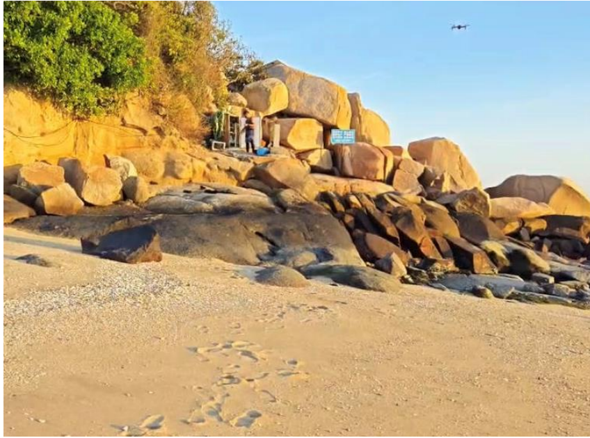
图为项目组人员数据传送基站

在这次检查中，同时替换了安装在海底珊瑚在线监测系统的 HOBO 温度记录仪，该记录仪记录了从 2023 年 12 月 8 日至 2024 年 1 月 18 日期间的水温数据，这些数据将为我们提供了解海洋生态系统温度变化的重要线索。