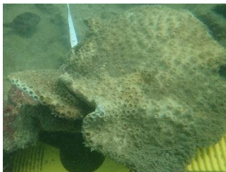
图为被掀翻的盾形陀螺珊瑚大面积白化, 最终死亡