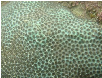
图为调查海域的锯齿刺星珊瑚

2024年2月，我们完成了《东山造礁石珊瑚修复项目——本底调查报告》。该报告对调查的3.36公顷海域（位于“福建东山省级珊瑚自然保护区”核心区——头屿片区内，于2023年8月完成的水下调查）的造礁石珊瑚种类、覆盖率、优势种、补充量等进行了详细的数据分析。