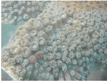
图为调查海域的盾形陀螺珊瑚

在报告中, 我们也对珊瑚白化和死亡原因进行了初步分析, 并提出了几点管理建议。我们希望这份报告是我们为保护海洋生态环境所做的一份努力见证, 也是对未来海洋生态系统保护工作的一种指引。