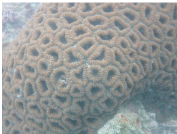
图为调查海域的标准蜂巢珊瑚