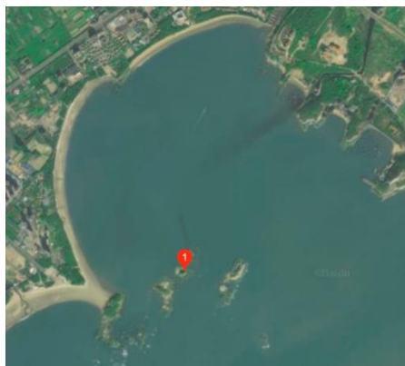
图：头屿水下调查区域（蓝框内）

8月的月底，我们完成了对“东山珊瑚省级自然保护区”核心区——头屿片区内3公顷区域进行了造礁石珊瑚的水下本底调查工作。