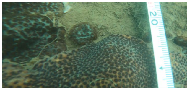
图：新附着的锯齿刺星珊瑚