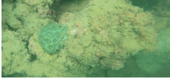
图：新附着的标准蜂巢珊瑚