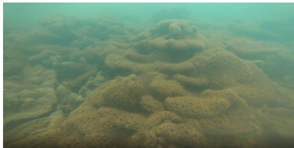
图：大片的盾形陀螺珊瑚

潜入水下后就好像来到了新的世界，我们发现了新附着的小块珊瑚，也有发现少量白化珊瑚，以及掀翻的珊瑚。