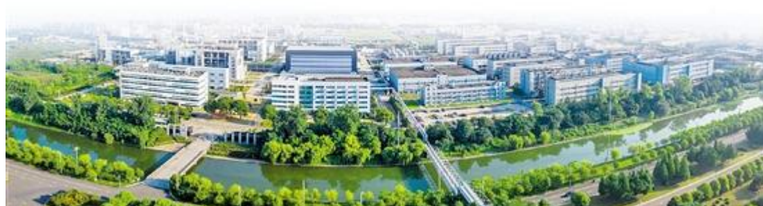
浙江新和成上虞无废园区生产基地

在具体实施方面，中国各地也在积极探索和推进无废城市建设。例如，绍兴市通过推动工业绿色发展与农业废弃物资源化利用，创建了超过300个“无废细胞”，并通过各种媒体形式宣传“无废城市”理念，提升公众对“无废社会”的认识和参与度。重庆市则通过创建“无废学校”“无废小区”“无废公园”等七类“无废城市细胞”，全面推动无废城市建设。