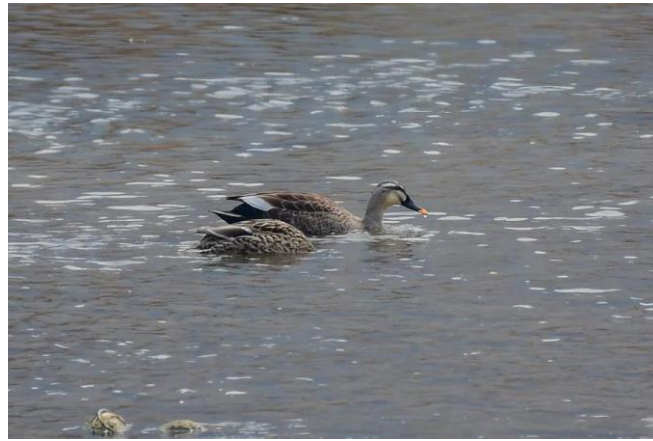
斑嘴鸭，2020 年 3 月 30 日，北京十渡

从高架路到五渡出口，步行到五渡桥上继续观察，刚下车没走几步就见空中 6 只黑鹳集群翩然盘旋飞行，还在这里大群的绿头鸭中记录到第二种鸭——斑嘴鸭。通往六渡的路口封闭，游客禁行，疫情还未结束，必须遵守纪律，虽然线路只到一半，调查只能结束。