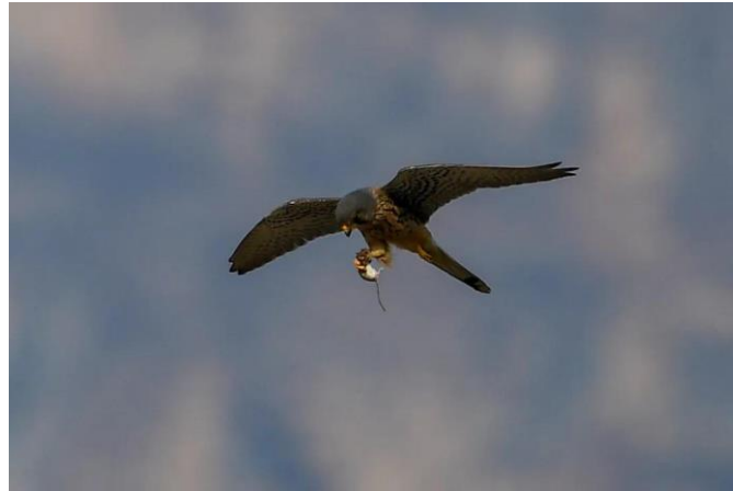
捕获猎物的红隼，2020年3月30日，北京十渡

迁徙过境的雁鸭类已经北上了，绿头鸭基本上是成双成对的在一起活动。一只红隼在河对岸的滩涂上空悬停，猛然扎下去，再腾起时，嘴里叼着一只老鼠，飞行中完成换到爪上。让人赞叹猛禽超强的捕食能力！