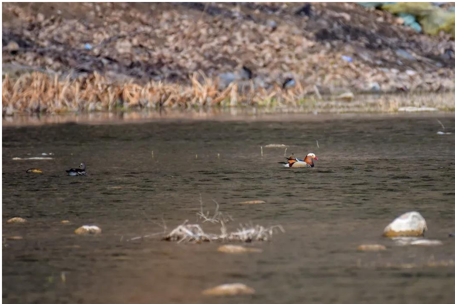
鸳鸯，2020年3月30日，北京十渡，摄影：中国观鸟会

三渡桥的一侧排满了垂钓的人，水较深，上游远处的苇丛附近有绿头鸭、鸳鸯、小鸬鹚在游曳、觅食。下游的远处也有一群绿头鸭。