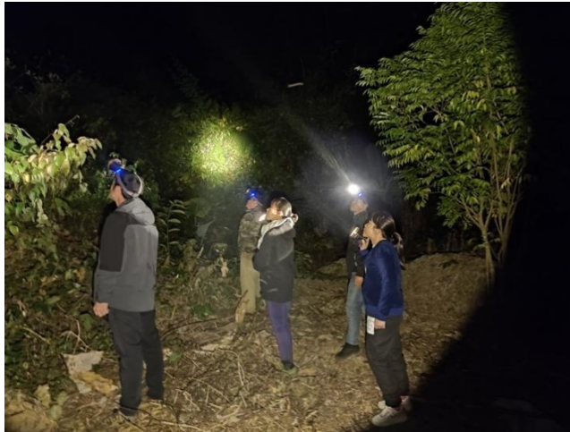
2025年1月巡护队夜间懒猴监测工作照