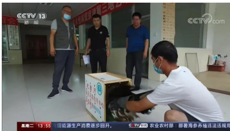
对金雕进行救助

北戴河翼展鸟类救养中心，是任鸟飞 2019 年度民间保护网络伙伴--秦皇岛市生物技术及应用研究所的联合执行机构，在鸟类救助方面具有丰富的专业经验。接到通知后，翼展鸟类救养中心第一时间通知秦皇岛市生物技术及应用研究所专家，同时组织人员带着鸟类救助药品及工具赶往近 300 公里外的承德滦平县进行救助。