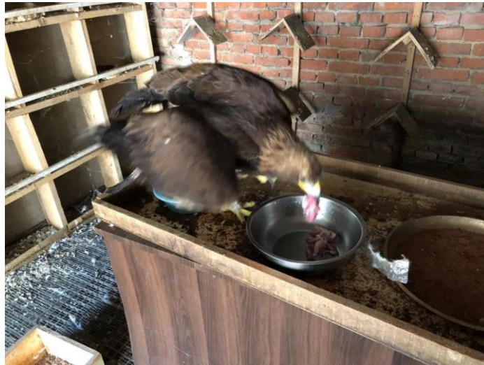
正在进食的金雕

到达基地后，工作人员对金雕投喂羊肉、活鸽、活鸡进行饲喂，以便其恢复体力。经几天观察，金雕行为正常，除左爪部有淤肿外，未见其他异常。饲养人员与金雕熟悉后，中心工作人员和秦皇岛市生物技术及应用研究所专家通过近距离观察，23日上午发现左爪内有刺，经处理已拔出。同时，中心积极联系兽医，下午带到宠物医院进行进一步处理。待观察会诊后将采取合理医疗手段对其展开治疗，以期恢复健康。