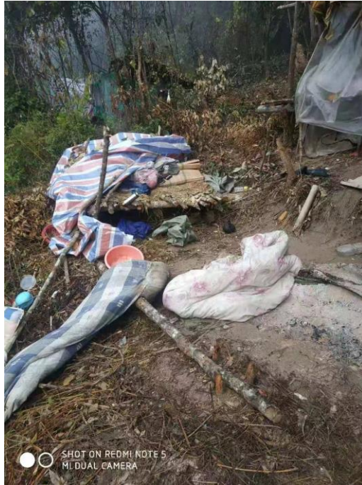
被公象老二毁坏的临时工棚

大象到来之前，所有人撤离抚育间伐区域，待 3 天后大象离开，能够安全工作后再返回林中进行抚育间伐。间伐工作于 2020 年 1 月 5 日全部完成。12 月，森林抚育间伐已完成 1400 多亩。