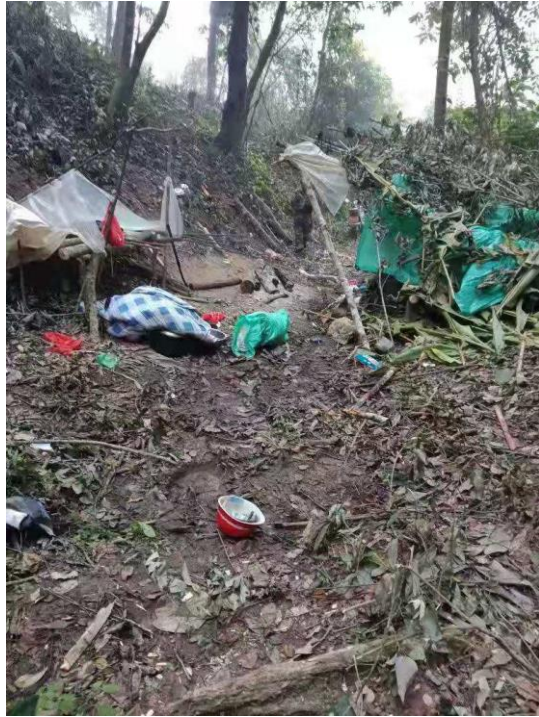
被公象老二毁坏的临时工棚

公象到达的前几天，46 位村民在做守护亚洲象二期抚育间伐的工作。因为抚育间伐区域离村民家有 20-30 公里的距离，每天回家时间成本较高，所以工作期间村民搭建临时工棚在林子里食宿。晚上住的临时工棚是使用木头支架架起防雨塑料搭建而成，“床”则是铺盖放在地上或者放在木头架子上。