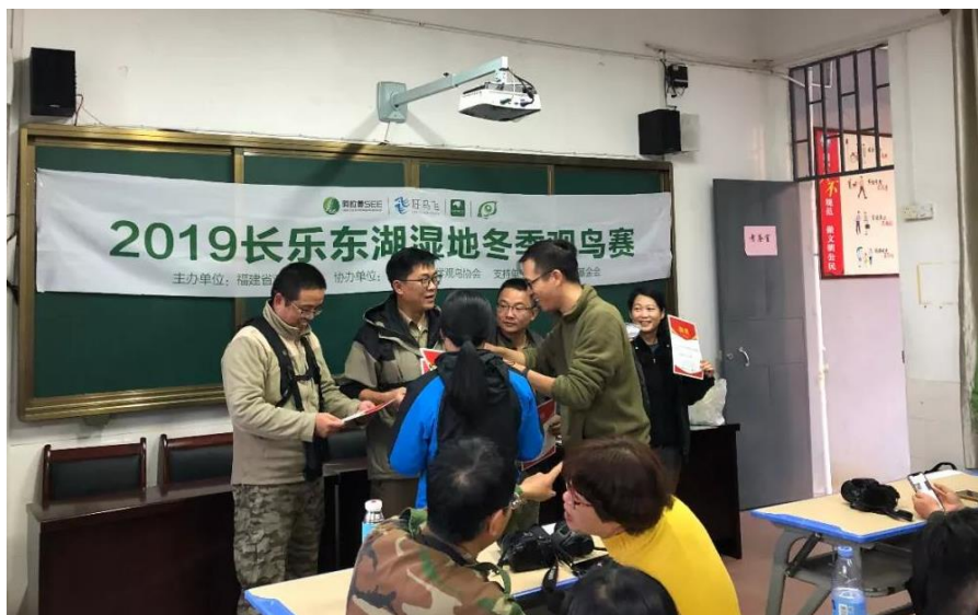
观鸟赛颁奖现场

事，也了解了科学观鸟、爱鸟护鸟的知识。对新鸟人来讲，最大的收获是了解滨海湿地的越冬水鸟的种类与数量。新老鸟人共同参与，既增进了友谊，又交流了经验。