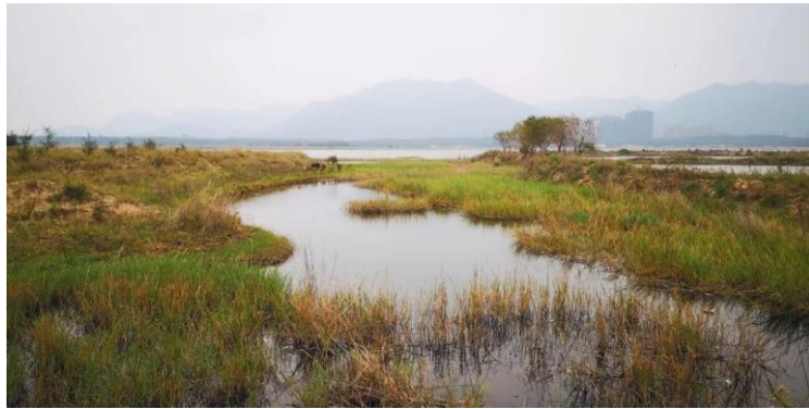
长乐东湖湿地

观鸟比赛，就是参赛队伍在规定时间内使用望远镜观察规定地点范围内的野生鸟类，通过判断种类并完成记录来进行比拼的比赛。本次观鸟比赛旨在传播爱鸟护鸟理念，亲近自然，提高公众对鸟类保护、对环境保护的意识，保护迁徙候鸟，为东湖湿地生物多样性的科学保护提供鸟类种群数据，促进社会对鸟类其栖息地的关注，推动湿地的生态发展。