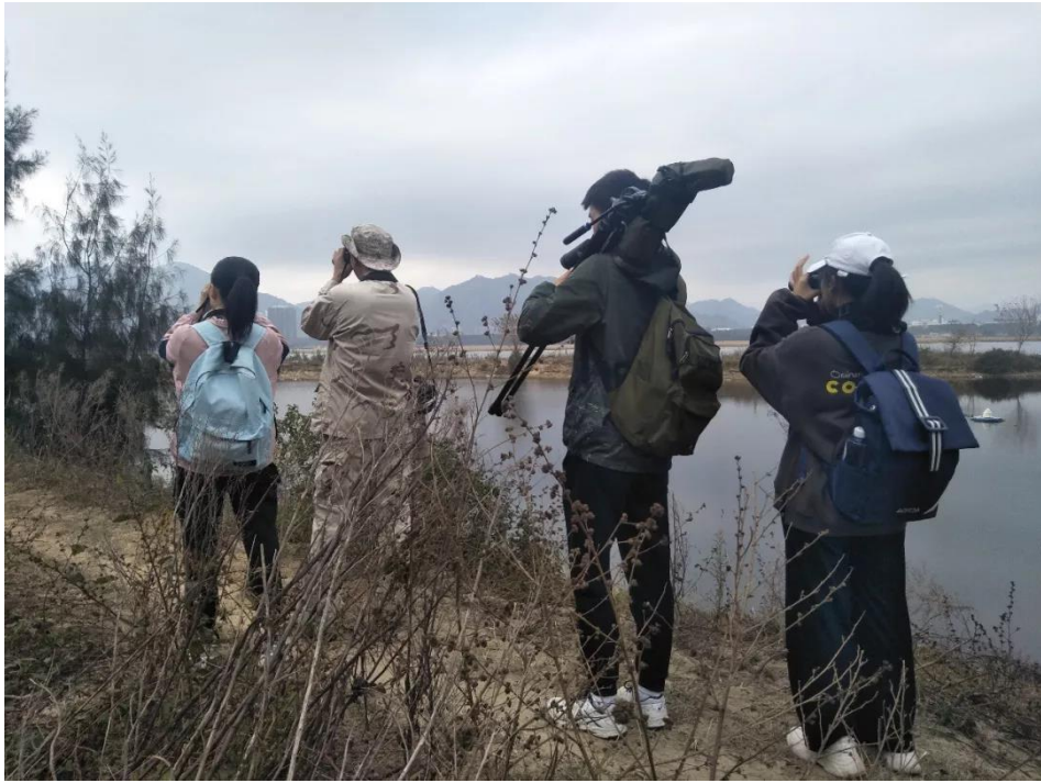
参赛队伍正在观鸟